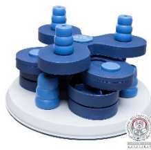
Casse-tête Trixie ©