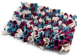
Tapis de fouille